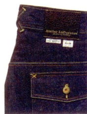
左はスカルの重ね刺繍がカッコいいChatav Ectabitのリメイクデニム。右はクロスパッチポケットやカッティングなどディテールワークが冴えるAtelier Ladurance